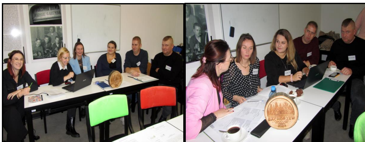
Grupa Odnowy Wsi w czasie warsztatów opracowania Sołeckiej Strategii Rozwoju Kamienica Kultury w Jarocinie w dniach 08-09.11.2024 r.